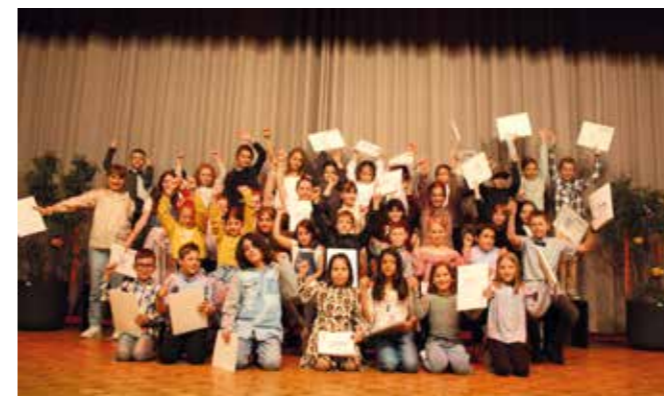
Diplomfeier, März 2024