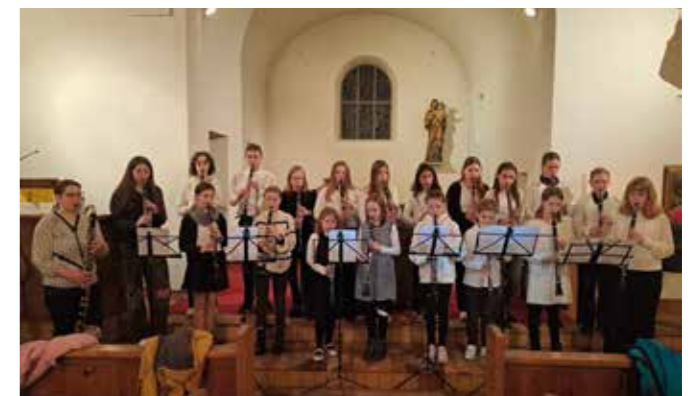
Benefizkonzert, Dezember 2024