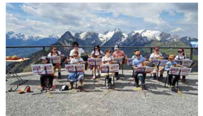
Buuremaart auf dem Hohen Kasten, Mai 2024