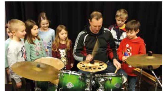
Schlagzeugvorführung, März 2024