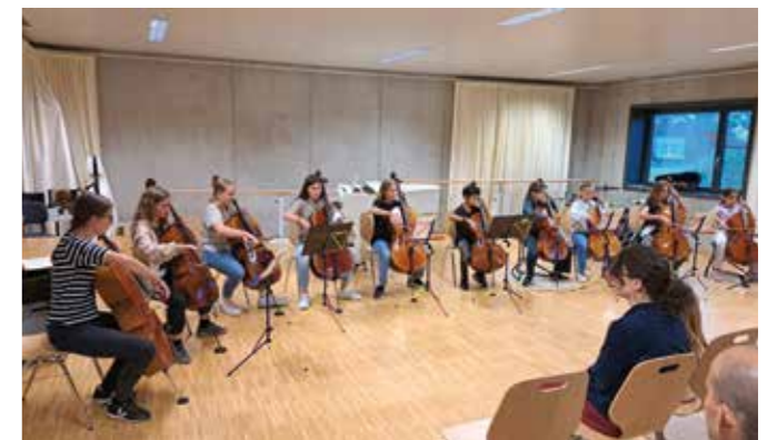
Klassenvorspiel Violoncello, September 2024