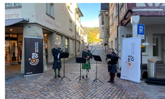
Buuremaart, September 2023