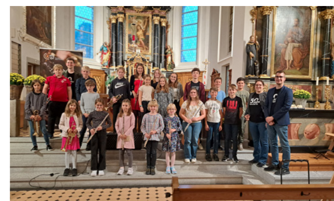
«Kobelwald klingt», September 2023