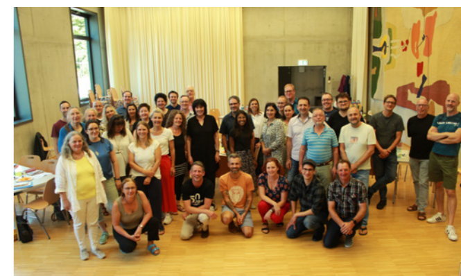
Semesterkonferenz, August 2023