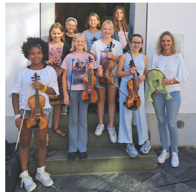
Buuremaart, September 2023