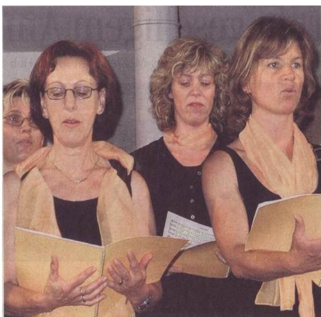
Der Chor Novum unterhielt das Publikum hervorragend.